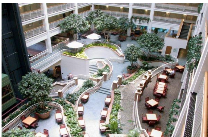
Embassy Suites Chicago Downtown

Tidlig registrering frem til 26. april 2018, registrering kommer i tillegg til basispakken